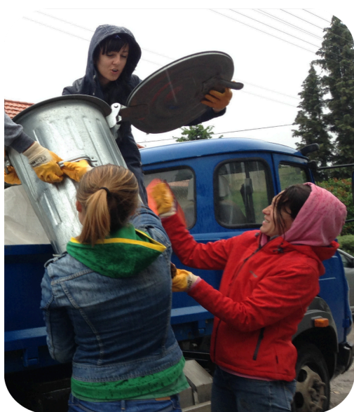
Naša prvá analýza odpadu, 2016